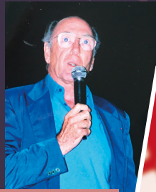
CLAUDE PINOTEAU | 2000

« L'amitié, la chaleur humaine, des paysages de rêves, un séjour inoubliable ». Claude Pinoteau