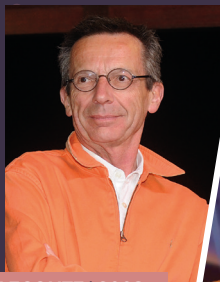
PATRICE LECONTE | 2008

« Cinéma, chute libre, bougna, fougères arborescentes, île aux chevaux... Tout était parfait ! ». Patrice Leconte