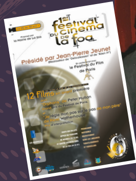
JEAN-PIERRE JEUNET | 1999