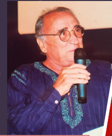
CLAUDE BRASSEUR | 2006

« J'ai vu la mer ! Des fleurs ! Des oiseaux ! Des coraux ! Des courts-métrages ! Tout merveilleux... ». Claude Brasseur