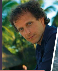
CHARLES BERLING | 2003

« Vous faites le cinéma de toutes les couleurs, ne perdez pas ce qui vous anime ici ». Charles Berling