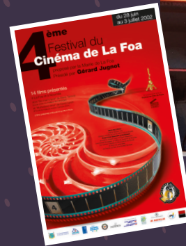
GÉRARD JUGNOT | 2002

« Merci infiniment pour votre générosité, votre cœur et votre enthousiasme ». Catherine Jacob