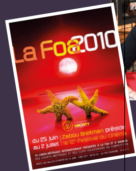
ZABOU BREITMAN | 2010

« Un festival formidable de simplicité, de chaleur humaine et de qualité artistique ! Je ne vous oublierai jamais ». Cécile de France