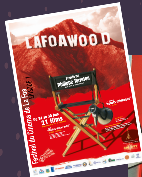
PHILIPPE TORRETON | 2005

« We were surrounded by fish, fish with faces like angels ». With much love, Jane Campion.